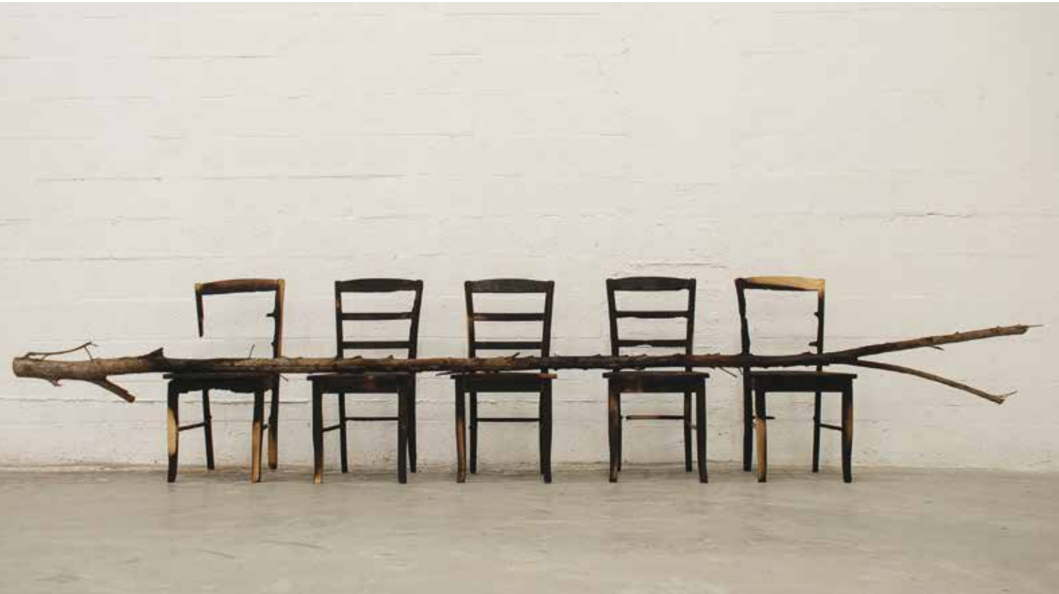
Studio/Estudio Enrique Martínez Celaya, Miami, Florida, 2013

than handsome, with his / neck pursued by the yoke for his neck." The poem concludes with a Republican call to arms, which is not reproduced but relevant nonetheless: "Who will save this little boy / smaller than a grain of oats? / Where will the hammer come from, / that executioner of this chain? / Let it come from the heart / of these day-laboring men / who before becoming men are / and have been plowboys." Combined, these images of skate, yoke, and hammer create associations that run in multiple directions, and overwhelm with their indeterminacy.