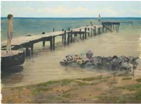
The Dock , 2013. Oil and wax on canvas, 116 x 150 in Óleo y cera sobre tela, 294.6 x 381 cm

picture of a snowy forest made from paint, tar and feathers, a pile of branches, a poem by the artist written on a wall, entitled, "Poisonwood," and a single empty chair; a symphony orchestra plays the protagonist's later concertos. Rather than fusing art, poetry, and music, the redundant formats reveal the inadequacy of each to its subject. How could it be otherwise? No one can imagine the end of days. "I was humbled by the futility of Schneebett ," Martínez Celaya remarked in 2006.